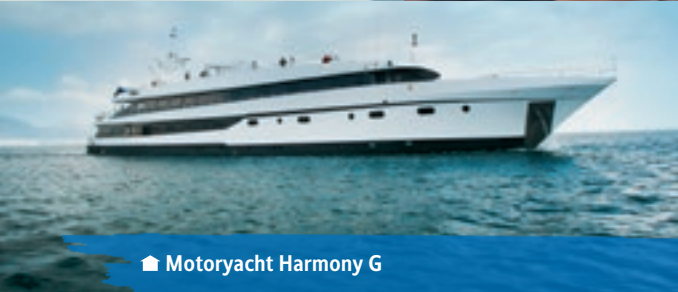
🏠 Motoryacht Harmony G