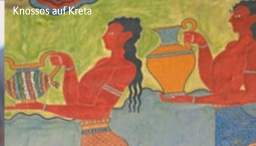
Knossos auf Kreta

Tag 5: Kurs auf die Vulkaninsel Santorin . Schon bei der Einfahrt leuchten uns die schneeweißen Häuser entgegen, die wie Knospen aus den 300 m hohen Steilwänden sprießen. Wir überwinden die Steigung elegant per Seilbahn, die uns hinauf nach Fira trägt. Wer oben Lust auf eigene Wege hat, marschiert auf dem Panoramaweg (3,5 Std., mittel) am Kraterand entlang bis nach Ia. Alle anderen fahren mit dem Bus quer über die Insel und hinauf auf den Profitis Ilias, der Ihnen spektakuläre Blicke auf die Caldera schenkt. Was die Vulkanerde an Früchten hervorbringt, kosten wir im Anschluss bei einer Weinprobe. Danach: Zeit für Firas verwinkelte Gassen.