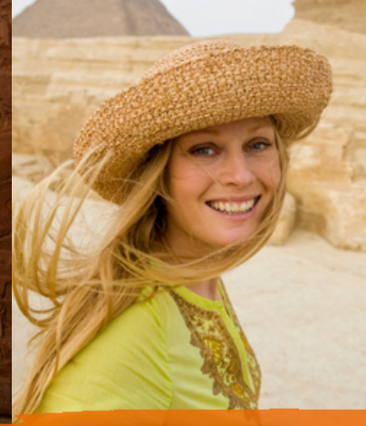
Villa Belle Epoque | Kairo