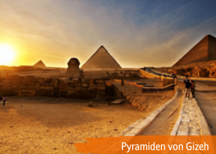
Pyramiden von Gizeh