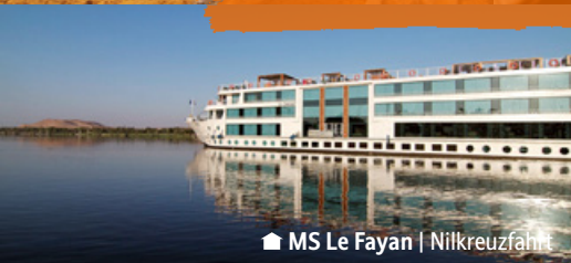
MS Le Fayon | Nilkreuzfahrt